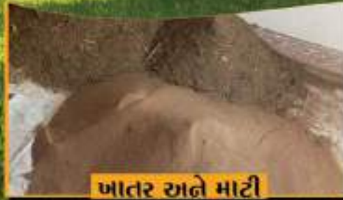
ખાતર અને માટી